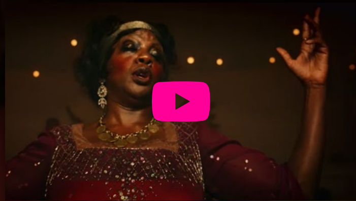
Deep Moaning Blues