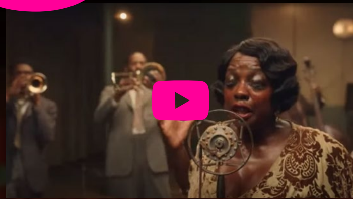
Ma Rainey's Black Bottom